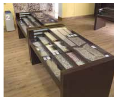
Museo del Merletto di Burano Primo piano, Sala 2