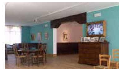
Museo del Merletto di Burano Sale espositive al primo piano