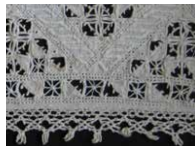
Merletto, XVI sec., Collezione del Museo