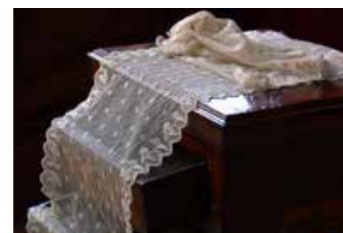
Merletto, XVII sec. Collezione del Museo