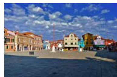
Museo del Merletto in piazza Galuppi, Burano