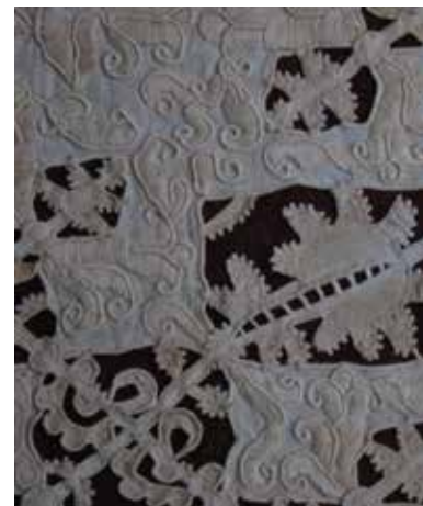
Merletto, XVI sec. Collezione del Museo

In passato si adoperavano filati di lino finissimo, ma anche seta, oro e argento, mentre dal secolo XX soprattutto cotone. Caratteristica principale dei merletti ad ago è la matericità, dei merletti a fuselli la leggerezza.