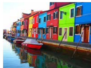
Isola di Burano