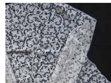
Merletti, XVII sec. Collezione del Museo