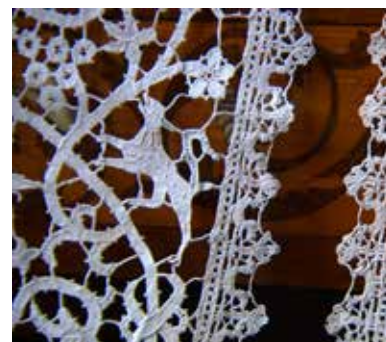
Merletto, XVII sec. Collezione del Museo