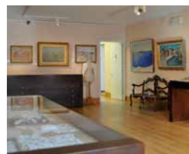
Museo del Merletto di Burano Primo piano, Sala 4