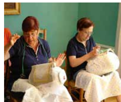
Museo del Merletto di Burano Primo piano, Sala 3