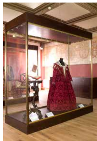
Museo del Merletto di Burano Primo piano, Sala 1