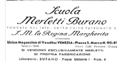
Manifesto anni '30 della Scuola dei merletti di Burano