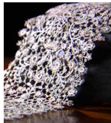
Merletto, XVII sec. Collezione del Museo