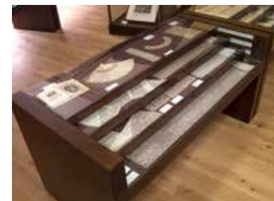
Museo del Merletto di Burano Primo piano, Sala 2

I motivi decorativi seguono quelli proposti nelle stoffe da abbigliamento: nella prima metà lussureggianti e commisti a elementi rocaille, nella seconda "a meandro" con fiori di pesco e rose e nell'ultimo quarto con forte alleggerimento e banalizzazione degli stessi.