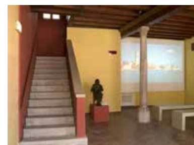
Museo del Merletto di Burano Piano terra